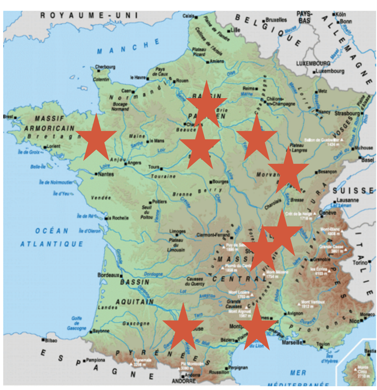
Collects January 2015