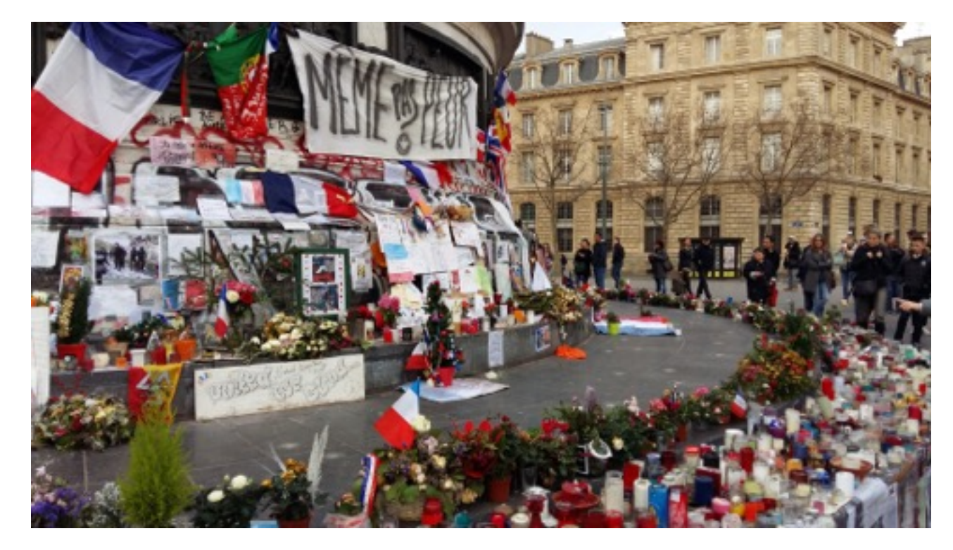
Place de la République, Paris, December 2015