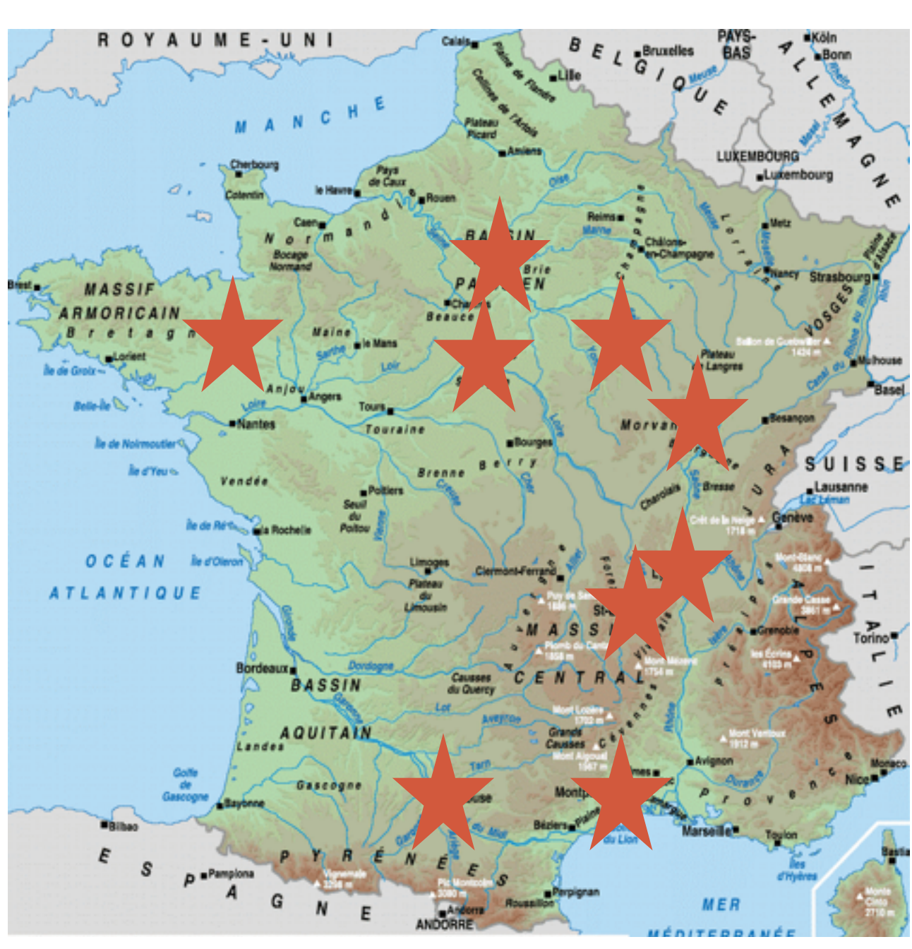
Collects January 2015