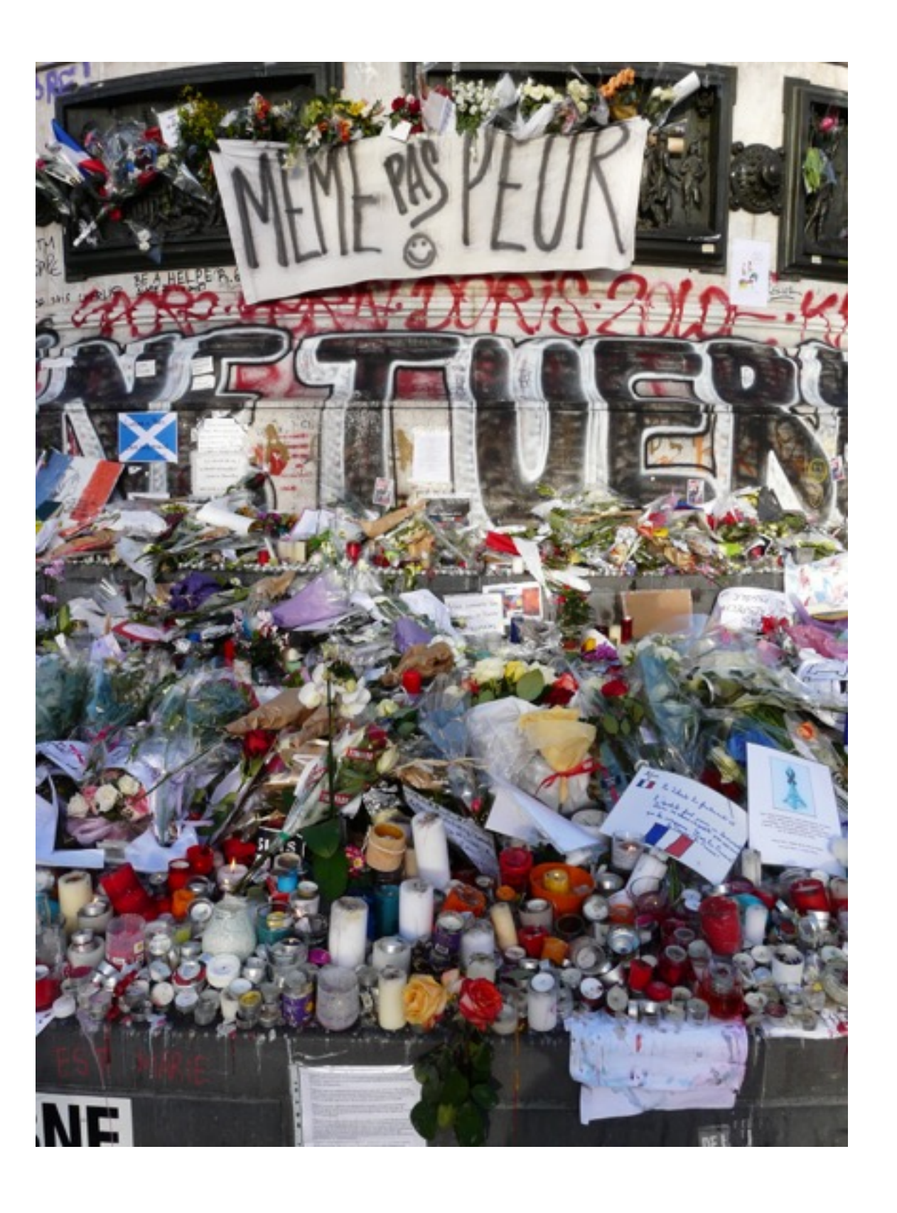
Place de la République, 2015