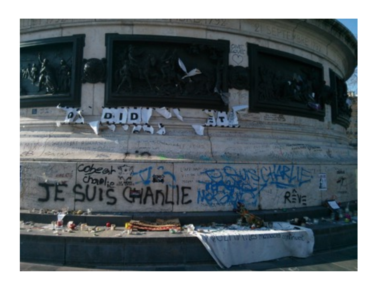
Place de la République, Paris, 13 February 2015