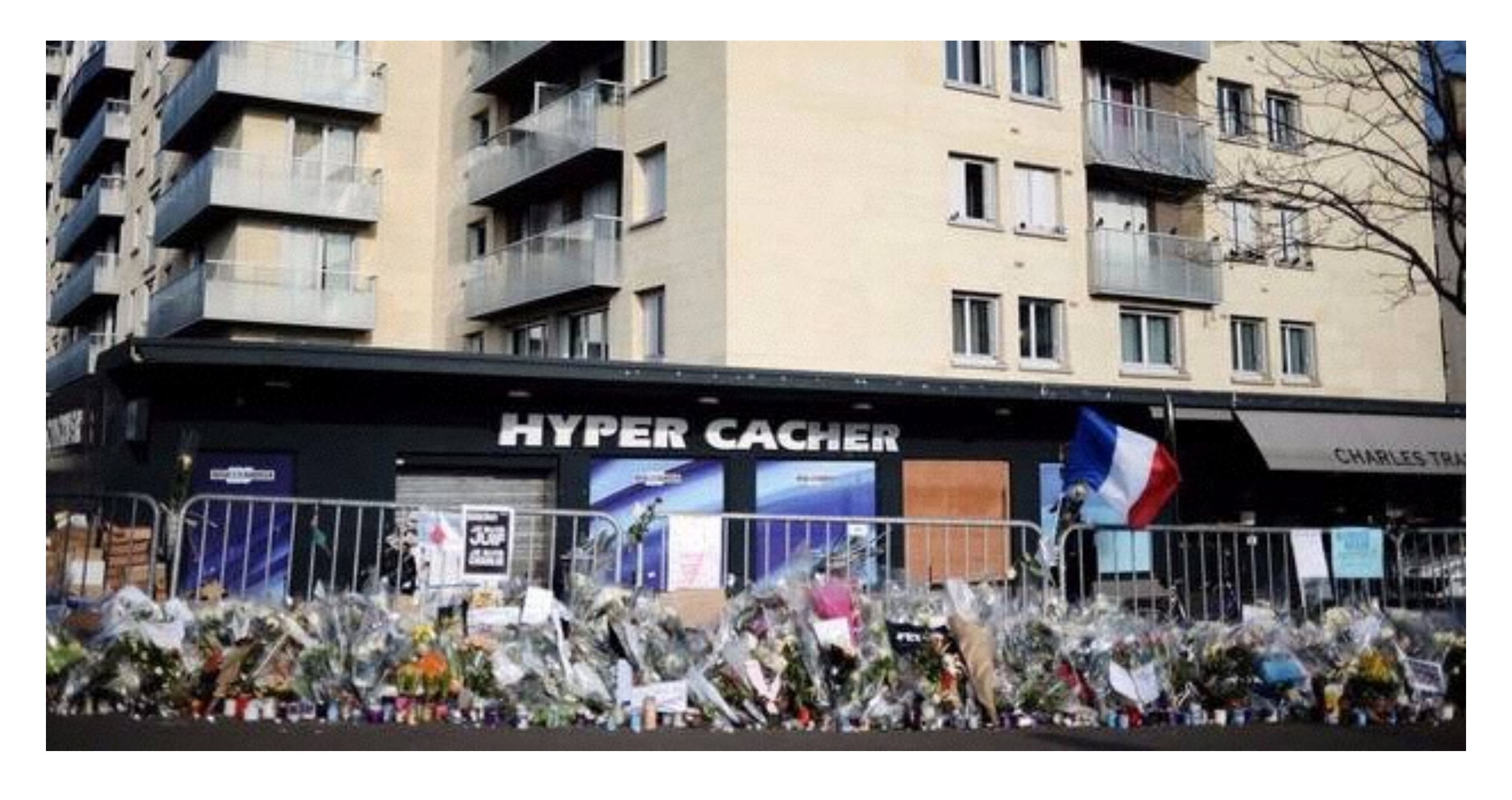
Hyper cacher, Porte de Vincennes, Paris, January 2015