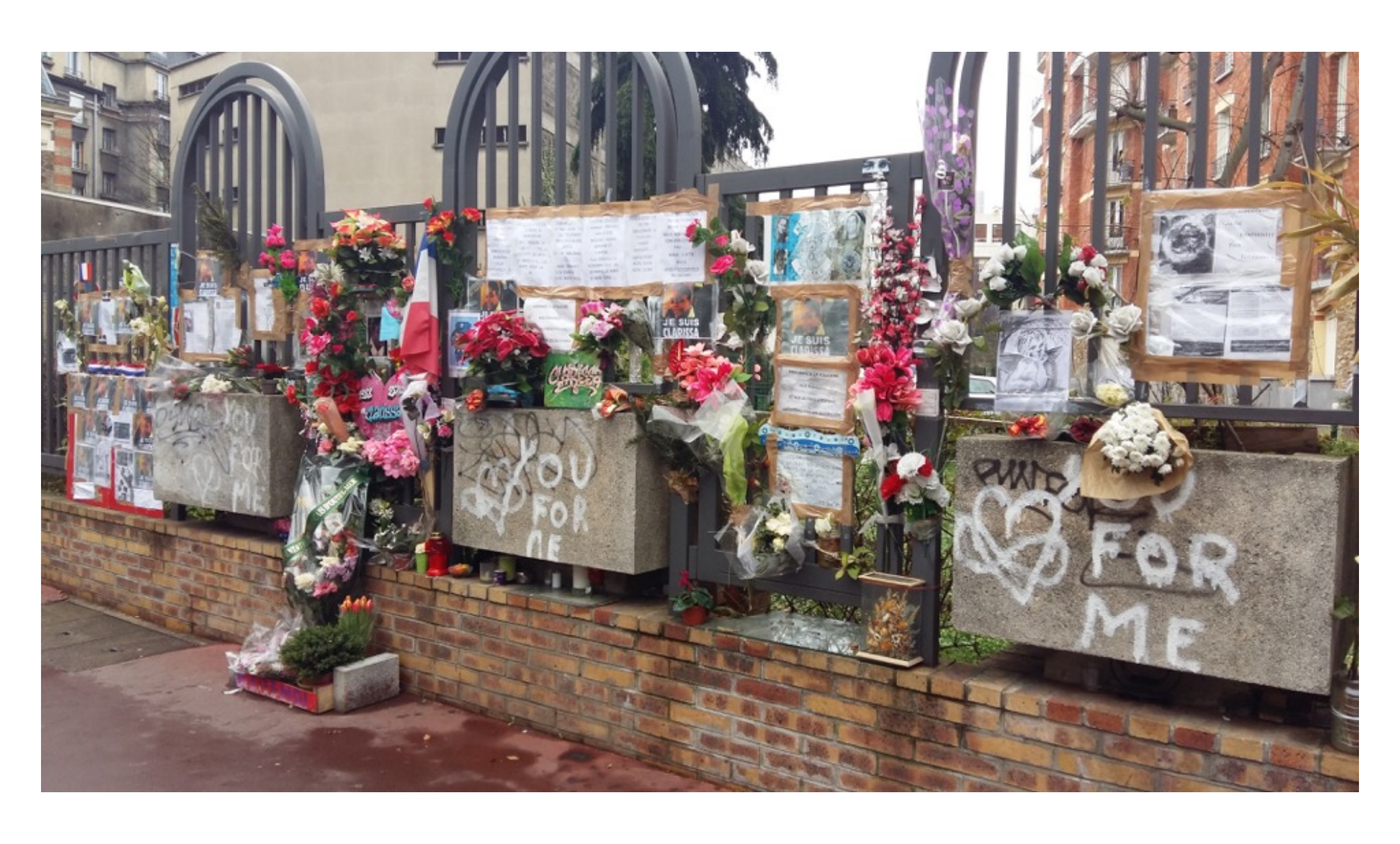
Montrouge, 2015